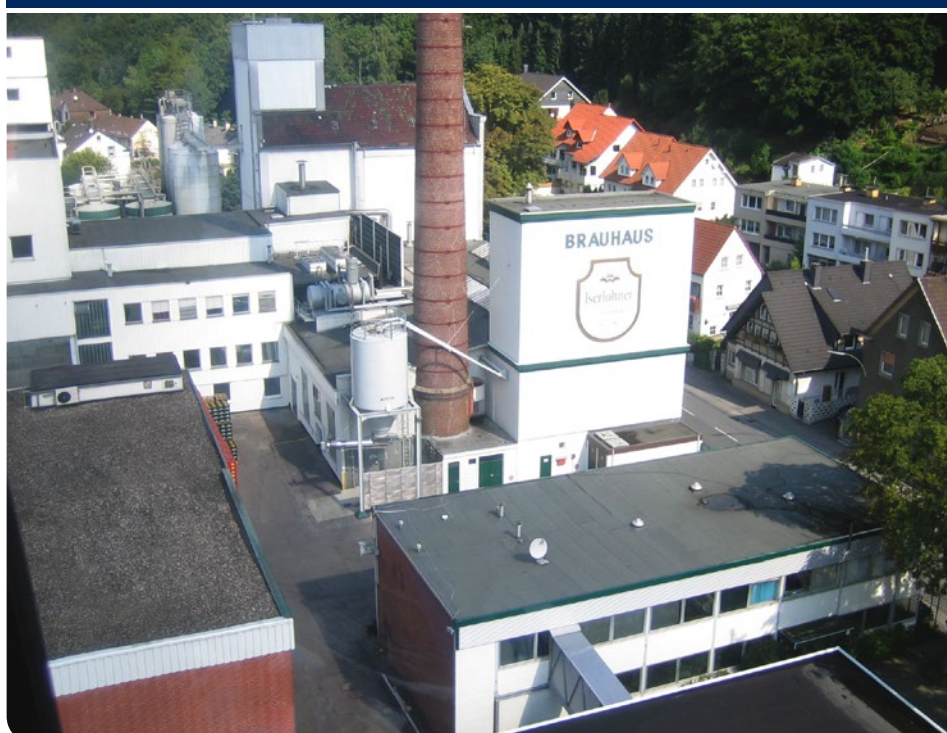
Verkauf sichert Chance auf Neustart in Iserlohn